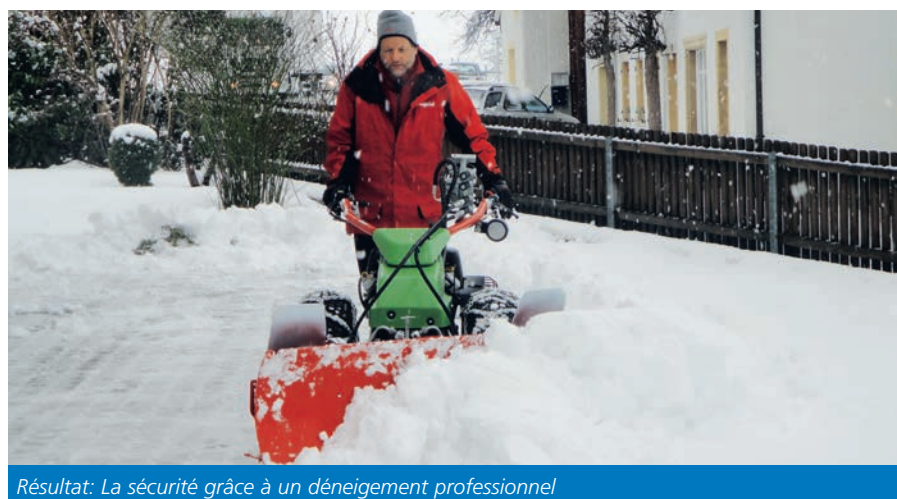
Résultat: La sécurité grâce à un déneigement professionnel