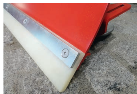
Racleur en vulcan

Si vous devez déblayer des surfaces de revêtement sensibles aux coups et aux rayures, il faut travailler de préférence avec un racleur en vulcan. Les barres de raclage optionnelles sont plus souples que les barres en acier, elles ménagent les surfaces et ne laissent pas de rayures.