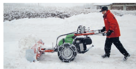
Encore plus de rendement et de confort lors du déblaiement de grandes quantités de neige grâce aux oreilles latérales, et sur la Rapid Euro grâce au dispositif pivotant hydraulique