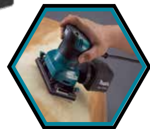
Machine très compacte.