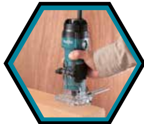
Légère et maniable.

Livrée avec guide à reproduire 10 mm, guide parallèle, guide à affleurer, fraise à rainures 6 mm et clé