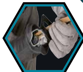
Changement de lame rapide.