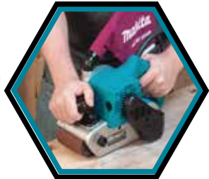
Grande surface de ponçage.