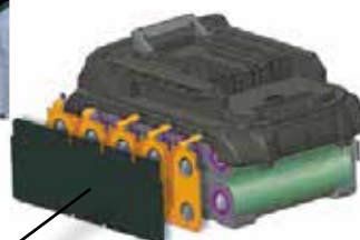
Structure étanche à 3 couches