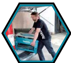
Pratique à transporter en véhicule.