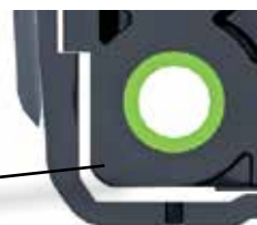
Structure d'absorption des chocs