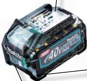
4-LED Etat de charge